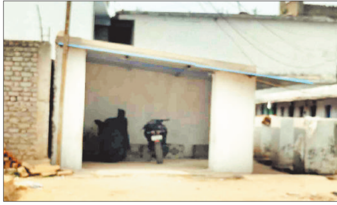
नोटिस के बाद की स्थिति।