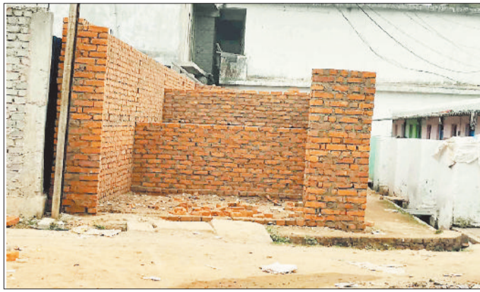
नोटिस के पूर्व की स्थिति।